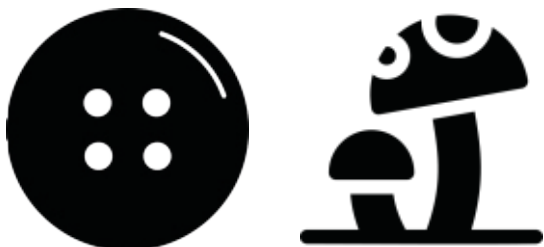
gomb - gomb