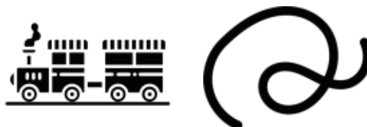
vonat - vonat