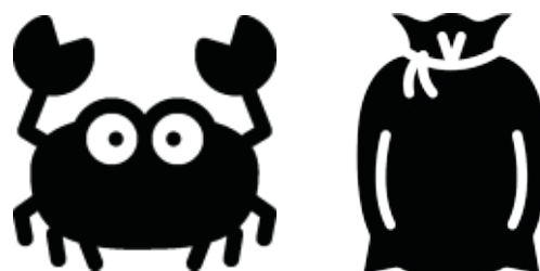
zsák - räk