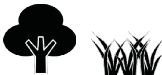
fa - fa