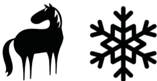
ló - ló