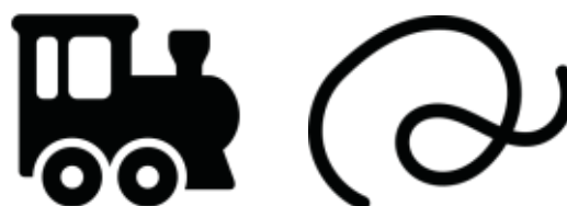
vonat - vonat