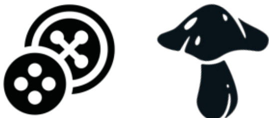
gomb - gomb