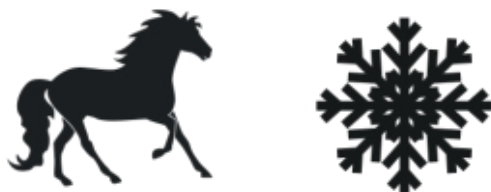
ló - ló